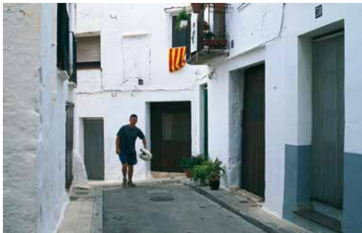
Diversos carrers encaminen el vianant vers la plaça Major

quet, un nom que ens recorda que en aquest punt es practicava l'antic joc de pilota anomenat igual. També ens parlaran de com el cafè es convertí en fàbrica de pinzells.