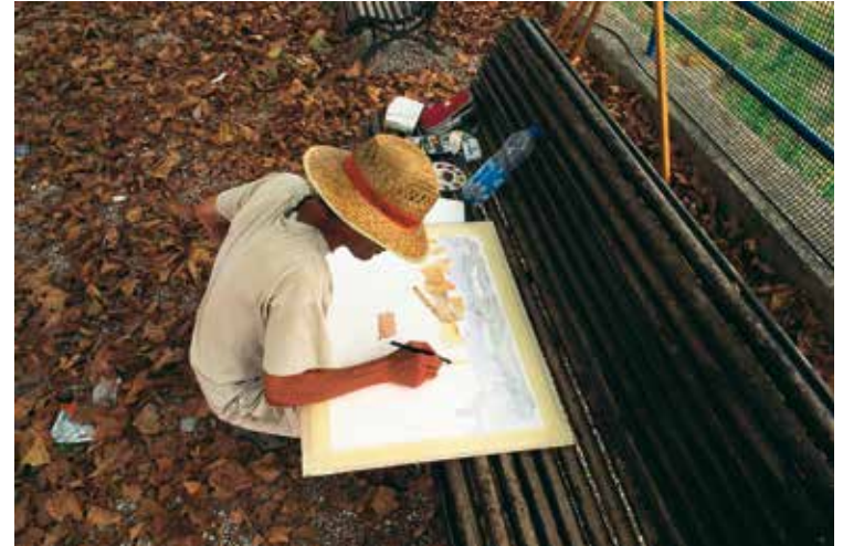
Des de les Cases del Riu un pintor recrea les construccions de la Sénia

Dues centúries fent paper. El progressiu desmantellament de la indústria tradicional a les Cases ha anat aparellat d'una minva de la població. Al llindar de la norantena Domingo Aliau recorda dos-cents veïns, quan avui no arriben ni de bon tros a cent. Una de les indústries grans era la fàbrica de Benigno (o de Pertegàs, o de Baix) , situada a un tirant de roc d'on ens trobem i al nord. Va acabar-se de construir l'any 1792 i funcionà fins al 1984, primer moguda amb aigua i després amb electricitat. Promoguda per Jaume Pertegàs, al segle XX passà a mans de Benigno Gil. Que havia estat molí paperer ho delaten les obertures de les angorfes (golfes) on el paper s'assecava. A Els molins paperers de Catalunya llegim que fabricà paper de barba, cartolines, paper de cigarreta i d'emalatge.