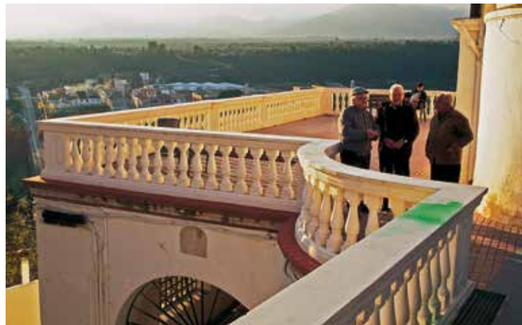
Les hores calmes de la vesprada propicien la conversa al mirador situat en un extrem de la plaça Major

Miradors. Que una població se situï en un lloc o altre no és fruit de l'atzar. En el cas de la Sénia devia ser determinant la proximitat de les aigües del riu Sénia, però també l'existència de terrasses al·luvials propícies als horts, el fet de dominar una important bocana que comunica el massís dels Ports i la marina, així com el pas d'un lligallo significat. El nucli primigeni es vertebrà mitjançant el carrer Major i es construí al planer que acaba precipitant-se en una successió de timbes que s'aboquen a la vall oberta pel riu.