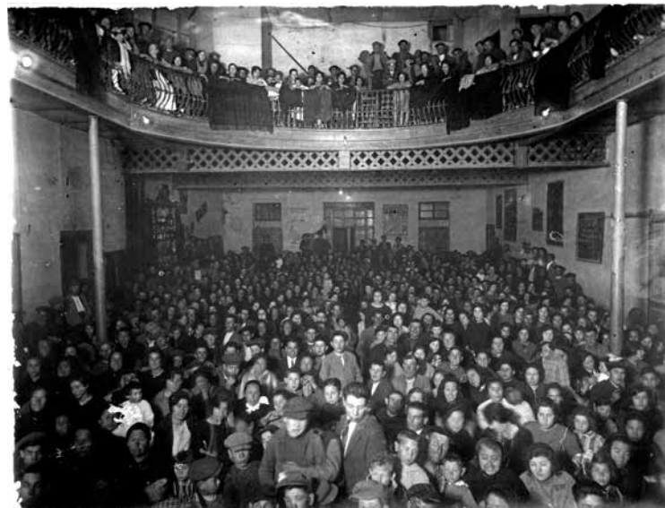
La Sénia en pes ha passat pel Centre Obrer